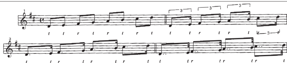
Voorbeeld 6 Anita Miller Rieder - Baroque Performance Practices for the Modern Flutist , p. 120

De Fransen gaven er zelfs een naam aan: men speelt 'inégaie' (ongelijk). Maar alleen in langzame delen heeft dat het gewenste effect, en dan met name als er veel zestienden in voorkomen, of de snelste beweging bestaat uit achtsten. In de 'hinkende' uitvoering kun je kiezen uit de 'luie' speelmanier, als triolen, meestal gebruikt in langzame delen, of een meer actieve versie van achtsten punt-zestienden, zoals o.a. in snelle Gavottes. Ook kan de waarde van punten overdreven worden (voorbeeld 6). Een punt achter een rust paste men nog niet toe, zodat de achtste noot in voorbeeld 7 korter gespeeld moet worden dan genoteerd staat.