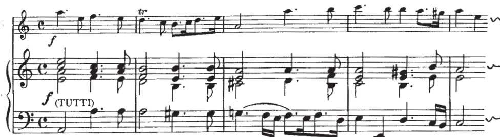
Voorbeeld 8 G.Ph. Telemann, Suite a kl., Overture, Lento m. 1 t/m 5

Voorbeeld 8 laat zien dat wat de componist opschrijft dus eigenlijk een skelet is, je moet niet spelen wat er staat. De achtste noten kunnen wat trioelachtig (dus later dan een achtste) gespeeld worden, zowel in de fluitpartij als de begeleiding (het orkest). In maat twee staat in de begeleiding als laatste noot een achtste, terwijl de fluit een wat luie zestiende (dus minder snel dan een zestiende) moet spelen. Verderop komt deze situatie nog regelmatig terug. Op al die plaatsen moeten fluit en begeleiding hetzelfde ritme spelen.