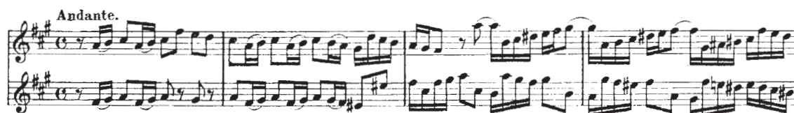
Voorbeeld 13 G.Ph. Telemann duet no.3, deel 3 Andante m. 1 t/m 4