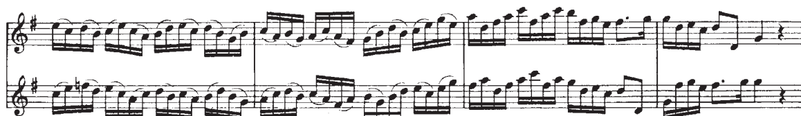
Voorbeeld 14 G.Ph. Telemann duet no.4, deel 3 Affetuoso m. 32 t/m 35