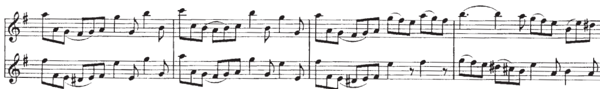
Voorbeeld 9 G.Ph. Telemann duet no.2, deel 4 Allegro m. 27 t/m 29

Elke noot wordt in principe los, dus met een (tong)aanzet gespeeld; 't', 'd', 'l' of 'r' is de normale articulatie. Bogen zijn versieringen en versterken een bepaalde speelwijze, die misschien ook wel zonder echt te binden zou kunnen worden bereikt.