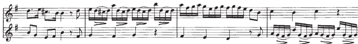
Voorbeeld 12 G.Ph. Telemann duet no.2, deel 2 Allegro m. 39 t/m 41