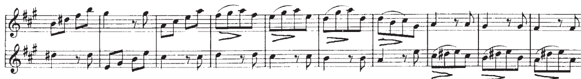
Voorbeeld 11 G.Ph. Telemann duet no.3, deel 4 Allegro m. 86 t/m 92