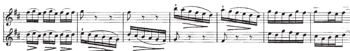
Voorbeeld 10 G.Ph. Telemann duet no.1, deel 4 Vivace m. 54 t/m 58